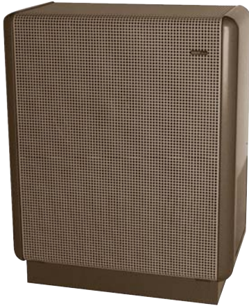
Standmodell/Modèle à poser

Den vollautomatischen Warmluftofen SIBIRtherm gibt es in zwei Ausführungen – als Stand- oder Einbaumodell. Eine ideale Lösung bietet der Einsatz einer zusätzlichen Schaltuhr für Ein-/Aus-Betrieb oder die Absenkung der Raumtemperatur (2. Raumthermostat notwendig). Mit einer telefonischen Schaltverbindung ist die optimale Beheizung von Werkstätten, Büros, Ferien- und Wochenendhäusern gewährleistet. Gehäusefarben: braun-beige, anthrazit.