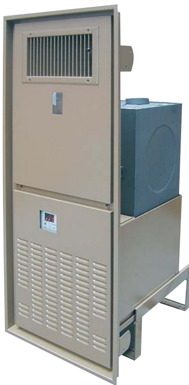
Einbaugerät mit Rahmen für Wandnische/ Modèle à encastrer avec cadre pour une niche murale

Vollautomatischer Warmluftöfen als günstige Alternative zur Zentralheizung Les poêles à mazout entièrement automatiques une alternative peu coûteuse