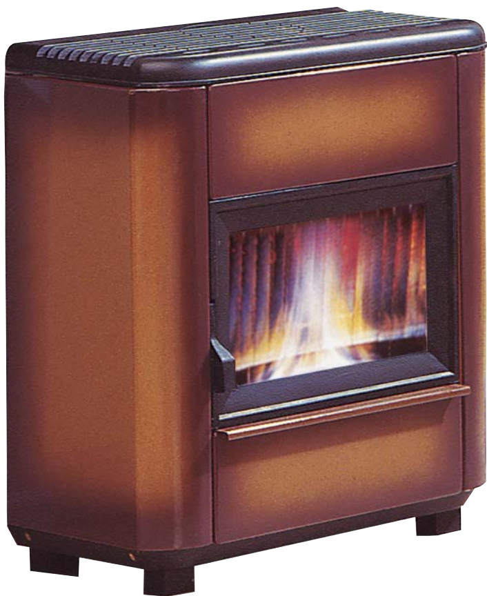
Terre de Sienne

Die Modelle Horizon 7 und 9 kW sind mit einem Ein-Wandbrenner ausgerüstet, der eine perfekte Verbrennung und eine aussergewöhnliche Leistungsfähigkeit sichert. Rauchabgang oben oder hinten. Die Modelle Horizon 7 und 9 kW werden nur mit Tank und in der Farbe Terre de Sienne geliefert.