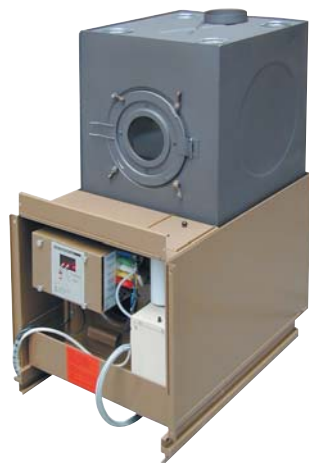
Einbaugerät für Kachelhülle/ Modèle à encastrer pour un habillage en carreaux de céramique

Le poêle entièrement automatique à air chaud SIBIRtherm est disponible en deux versions en tant que modèle à poser ou en tant que modèle à encastrer. Une solution idéale: l'installation d'une horloge qui permet d'enclencher ou de déclencher l'appareil ou de régler la température ambiante (un deuxième thermostat est nécessaire). Une liaison téléphonique de commutation permet de garantir un chauffage optimal. Coloris: brun-beige, anthracite.