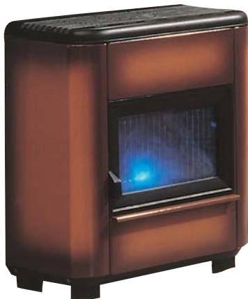
Terre de Sienne

Ganz neues Aussehen, 2 Farben: Terre de Sienne, Caviar. Flamme gut sichtbar durch breites Feuerglas. Mit Cristalis-Brenner ausgerüstet, der eine perfekte Verbrennung und eine aussergewöhnliche Leistungsfähigkeit sichert.